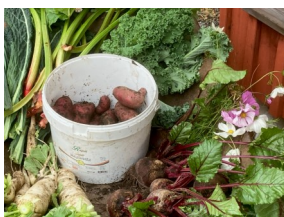
Potatis från Kila

Inne i den fullsatta skolsalens värme underhöll Lilla Bandet med sin härliga sång och musik. Många längtade efter att få dansa.