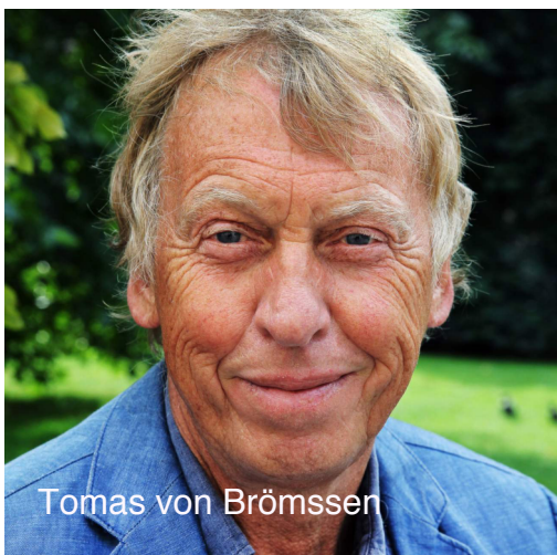
Tomas von Brömssen

Biljetter till kyrkans musikevenemang bokas på kyrkan@flaton.se